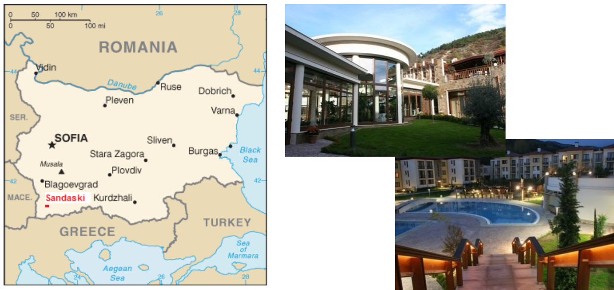
Фиг. 5 Мястото на провеждане на Втората среща на работните групи по Проект „ROWER” – парк-хотел „Пирин”, гр. Сандански, България

Втора среща на специализираните работни групи по Проект „ROWER” беше проведена в парк-хотел „Пирин”, гр. Сандански в периода 15-17 април 2010 г. 1 Организацията на работата среща ще бъде осигурена от Югозападния университет „Неофит Рилски”, гр. Благоевград, който пое грижата за всички аспекти по нейното провеждане (осигуряване на място за самата конференция, хотелско настаняване, изхранване на участниците и т.н.). Срещата, както беше вече посочено, се фокусира върху макроикономиката на здравеопазването и безопасността на работното място с акцент върху различните фактори на национало и обществено равнище.