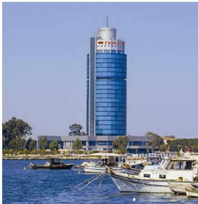
Фиг. 3 Мястото на провеждане на първата конференция по Проект „ROWER” – гранд-хотел „Плаза”, гр. Измир, Турция