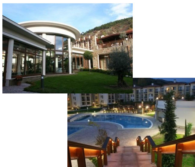
Фиг. 5 Мястото на провеждане на Втората среща на работните групи по Проект „ROWER” – парк-хотел „Пирин”, гр. Сандански, България