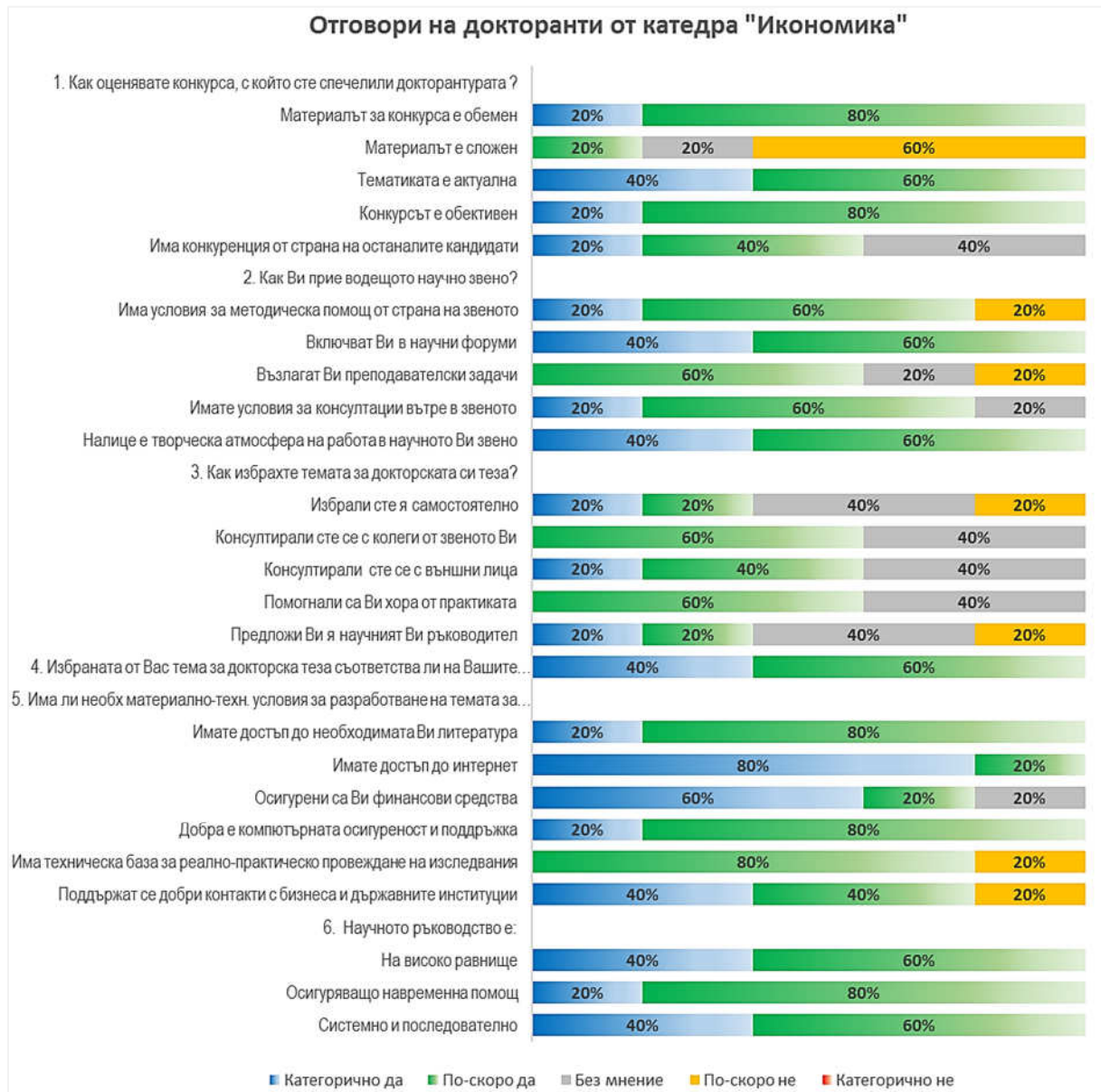
Фигура 2. Отговори на докторанти - катедра „Икономика“, Стопански факултет