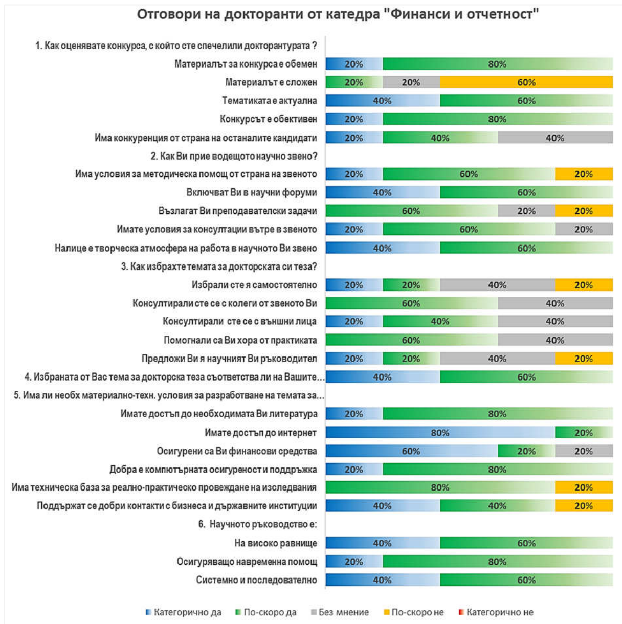
Фигура 1. Отговори на докторанти - катедра „Финанси и отчетност“, Стопански факултет